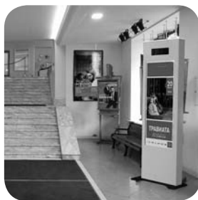
Рис. Инфозона театра — часть впечатления, которое остается у зрителя от театра в целом.

Демонстрация на экране инфозоны образовательно-познавательного контента поможет посетителям узнать и запомнить больше информации, заинтересоваться той или иной выставкой или экспозицией. Такие мелочи, как меню кафе или прогноз погоды, позволят посетителю почувствовать, что здесь о нем заботятся, ему рады.